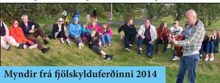
Myndir frá fjölskylduferðinni 2014